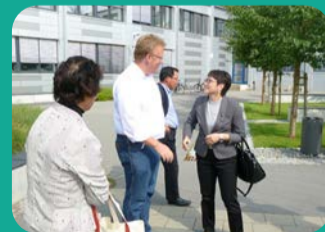
ドイツのDESY施設見学

回登壇し、1 期目でありな がら「決算特 別委員会」、 「予算特別委 員会」で総括 質疑の機会も いただきました 。たくさんの質問機会をいただ き、質問を重ね、「定期予防接種事 業の広域化」「病児保育事業の広域 化」「県庁内保育所の設置」の3つの 政策が実現いたしました。