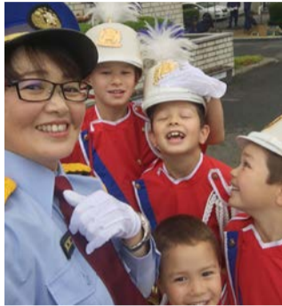
消防演習にて親子でラッパ隊

ハクセル：最初に出馬を決意したのは8年前でした。当時、私は専業主婦で3人の息子の 子育てに孤軍奮闘 していました。子育て中の家庭の状況を、社会は、行政は本当にわかっているのか？同じ状況の 女性の生の声 を何とかして 行政に届けたい と出馬を決意しました。「このチャンスは、君だけのチャンスではないよ。女性全体のチャンスなんだから、挑戦できる人が挑戦するべきだ。ボクは、主夫になってフルパワーで君の挑戦を応援する。」という夫の言葉に後押しされたことが決め手となりました。