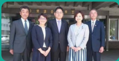
いわて県民クラブのメンバーと