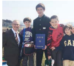
長男は無事小学校卒業

委員会では、例えば予算特別委員会なら予算のこと、東日本大震災津波復興特別委員会なら震災復興に関係したと質問できる課題が限定されています。苦労したのは、30分間でほしい 9000字の質問原稿 をまとめること、返ってくる答弁を予想しながら何パターンかシュミレーションして、再質問を考えること、そして、課題の中身をよく知らない有効な再質問ができないので、必死に勉強することです。勉強の時間も入れて、ほしい一カ月程度の時間をかけながら質問を作っていきます。一般質問作成期間中は、子どもたちの悩みも聞いてあげられないくらい、 必死です 。