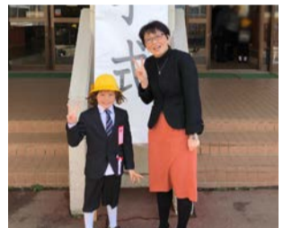
四男も無事小学校入学

ハクセル：私が議員になったきっかけである「 県民の生の声を県政に届けたい 」という思いを実現するには、今ある課題をどう解決していくべきかを、当事者である県民と議員が話し合える場をさらに作っていくことが大切です。また、当事者である人が議員になることで、例えば子育て中とか介護中とか実体験も踏まえた質問や提言ができることも県民のニーズにお応えできる県政を進めるためには重要なことです。その為には、いろいろな立場の方が議員になれる環境の整備をすることが大切です。また、議会の役割を分かりやすくお見せする方法を工夫して、 県民の皆さんのご意見が反映されやすい議会づくり を進めることも私たち議員の重要な仕事であると考えています。